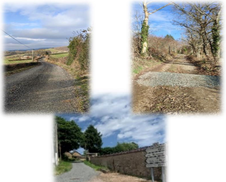
La réfection du chemin menant au hameau de Rangère sera effectuée, courant 2024

2023 aura été une année importante en matière de réfection de la voirie. En effet, nos agents municipaux et des entreprises spécialisées sont intervenus sur de nombreux chemins. Leurs interventions ont largement favorisé une remise en état du chemin de Cussy, celui des Rattes, du Creux et de la Prault.